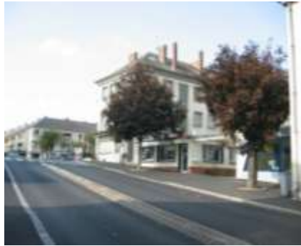
Rue de la Laiterie