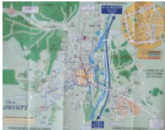
Plan actuel de Louviers