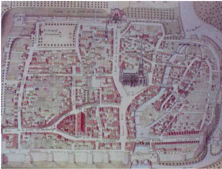
Le plan Bachelay Ce plan a été réalisé en 1748 par C. Bachelay. Il décrit avec précision des rues composant la vieille ville intra muros .

- Les deux plans ultérieurs ci-dessous montrent que l'extension de la ville reste faible jusqu'au milieu du XX e siècle.