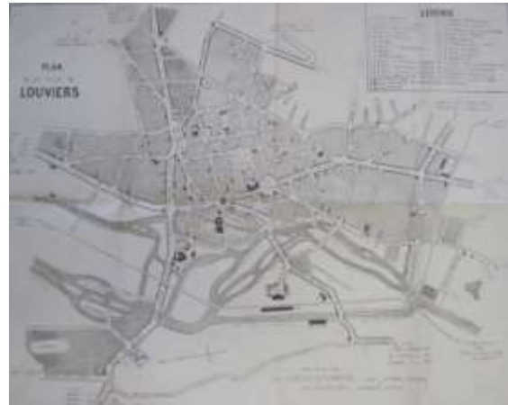
Plan des années 1920 – 1930.