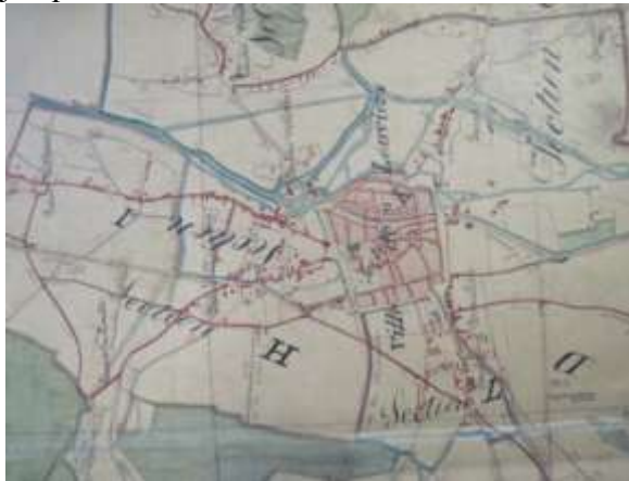
Extrait du cadastre de 1840.

- Les deux plans ultérieurs ci-dessous montrent que l'extension de la ville reste faible jusqu'au milieu du XX e siècle.