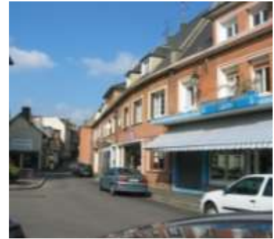
Rue aux Huiliers