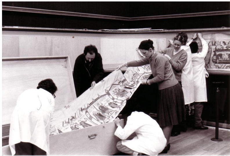
Dépose de la Tapisserie de Bayeux de sa vitrine de l'Hôtel du Doyen, novembre 1982.

Ces soixante dernières années n'ont vu d'autre bouleversement que celui des connaissances sur le textile lui-même. A l'occasion d'un déménagement, occasionné par le souci de l'amélioration de la muséographie, la Tapisserie a été étudiée par une équipe de restauratrices : relevés sur calques, photographies de l'endroit comme du revers n'ont pas fini de livrer leurs secrets. Tout n'a pas encore été dit sur la broderie la plus célèbre au monde !