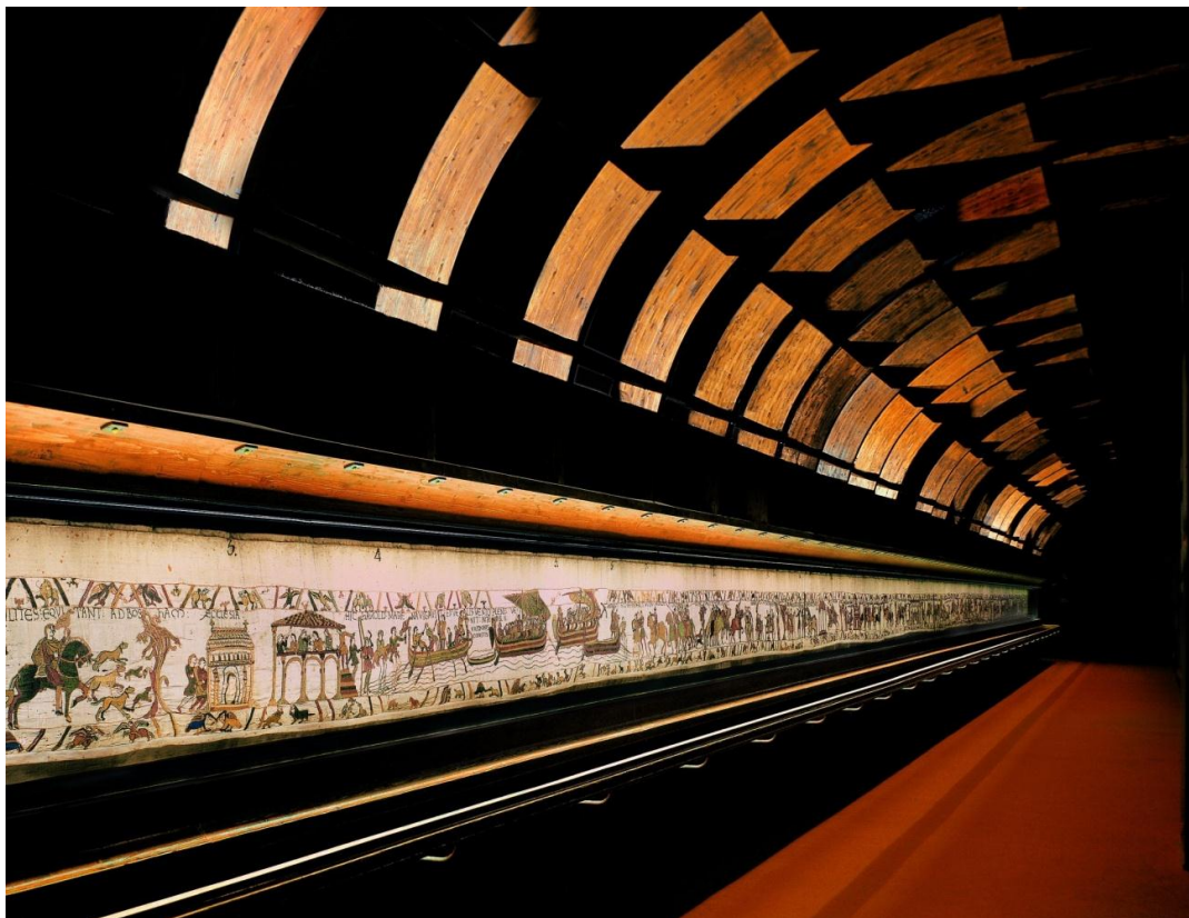
Galerie de la Tapisserie de Bayeux.